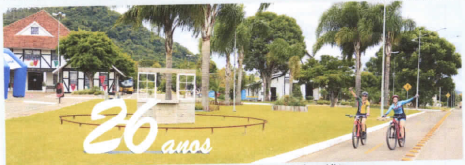
Trajetos contaram com percursos pelo Centro e Interior, oportunizando diversas paisagens naturais aos ciclistas

Westfália - Os 100 ciclistas participantes do 1º MTB Westfália, realizado no sábado, dia 26 de março, ficaram maravilhados com as belezas naturais do município que comemorou 26 anos de emancipação no dia 24. A programação ciclística reuniu vários participantes oriundos de cidades como Westfália, Teutônia, Estrela, Lajeado, Mato Leitão, São Leopoldo, Esteio, Sapucaia do Sul, Boa Vista do Sul, Guaíba, Arroio do Meio, Montenegro, Carlos Barbosa, Caxias do Sul, Passo Fundo, Barão, Nova Petrópolis, Garibaldi e Porto Alegre.